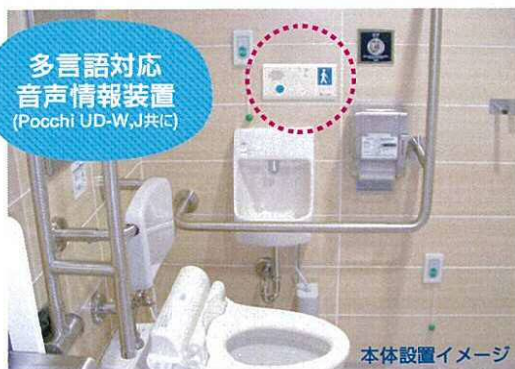
本体設置イメージ