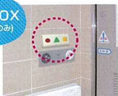
言語選択BOX設置イメージ